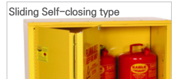
Sliding Self-closing type