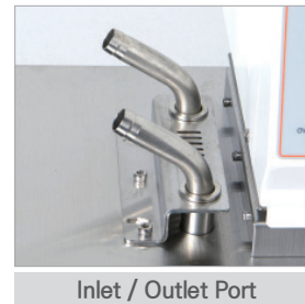
Inlet / Outlet Port