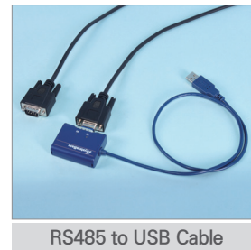
RS485 to USB Cable