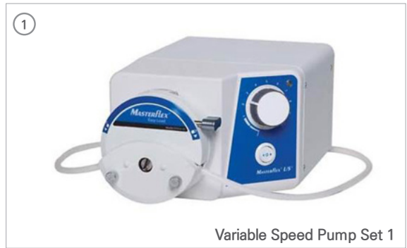
Variable Speed Pump Set 1