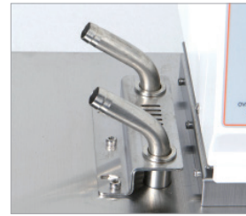
Inlet / Outlet Port