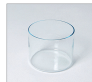
Spare Glass Bath