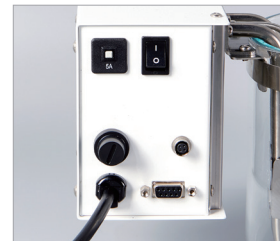
통신포트 & 외부센서