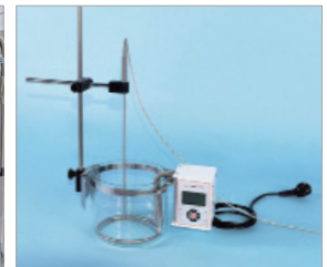
서포트키트 + 외부센서 설치