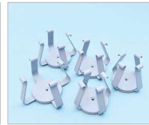
Flask Holder (ABS재질)