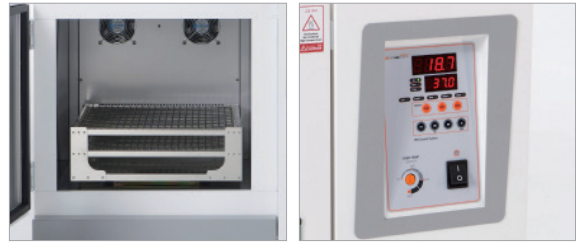
Spring Rack 장착 이미지