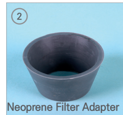
Neoprene Filter Adapter