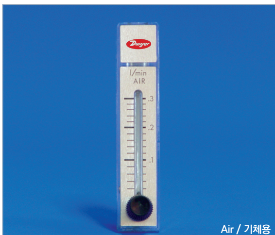
Air / 기체용