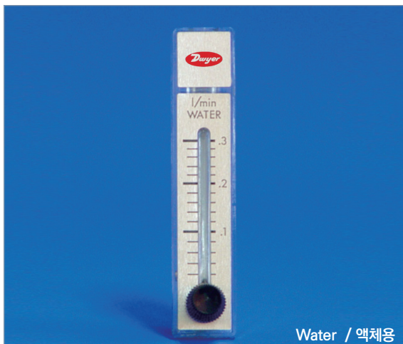
Water / 액체용