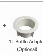
1L Bottle Adapter (Optional)