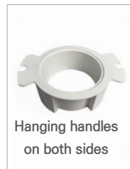
Hanging handles on both sides