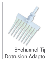
8-channel Tip Detrusion Adapter