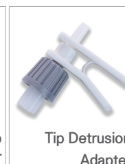
Tip Detrusion Adapter