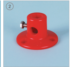
Table Clamp for Rod 테이블 클램프