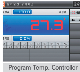
Program Temp. Controller