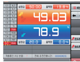
Temp. & Humidity Controller