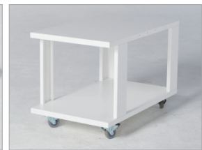
Table for LH-TP35, 65