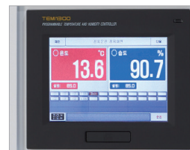
Temp. & Humidity Controller