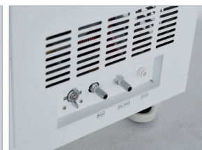
Water In & Drain Port